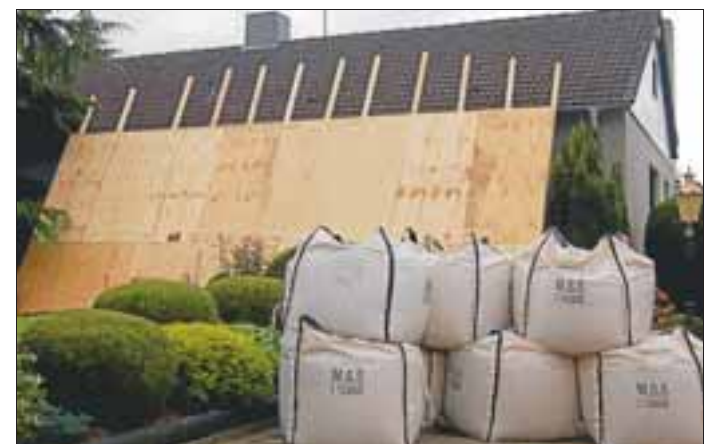
Das Wohnhaus neben der Fundstelle wurde mit Sandsäcken und Holzwänden geschützt.