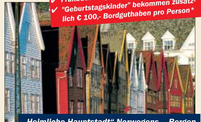
„Heimliche Hauptstadt“ Norwegens – Bergen

✓ Frühbucker sparen € 175,- pro Person ✓ „Geburtsstagskinder“ bekommen zusätzlich € 100,- Bordguthaben pro Person*