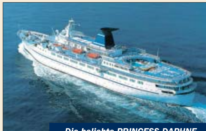
Die beliebte PRINCESS DAPHNE