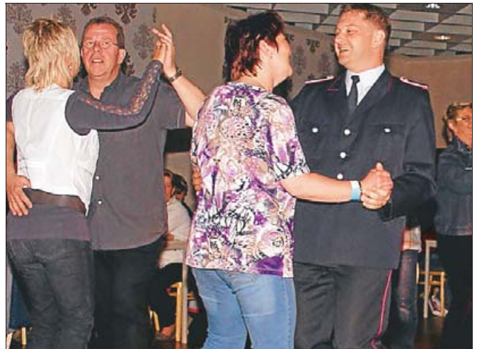
Das Tanzbein geschwungen wurde in der Gaststätte Schütte in Berne.